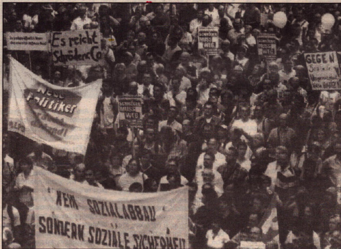
Χιλιάδες διαδηλώνουν κάθε Δευτέρα στους δρόμους των Γερμανικών πόλεων ενάντια στην "ατζέντα Σρέντερ" που αποτελεί μια γενικευμένη επίθεση ενάντια στην κοινωνική πρόνοια

Η συνδεση με τις ιστορικές "Διαδηλώσεις της Δευτέρας" δεν είναι τυχαία. Οπως και σήμερα έτσι και τότε ένα τεράστιο κίνημα, είχε γεννηθεί κυριολεκτικά από τα κάτω, από τους απλούς ανθρώπους. Οι "Διαδηλώσεις της Δευτέρας" το 1989 ανάγκασαν τελικά το σταλινικό καθεστώς του Ερικ Χόνεκερ σε οπισθοχώρηση - μια