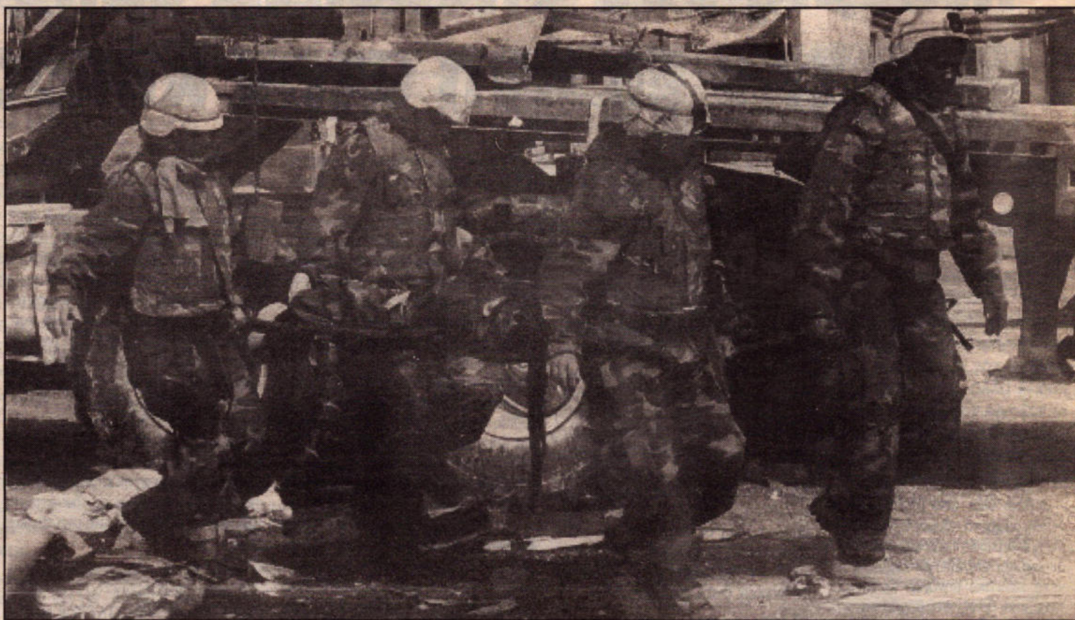
Οι νεκροί αμερικανοί στρατιώτες ξεπέρασαν τους 1000 και αυξάνονται καθημερινά τροφοδοτώντας την αγανάκτηση και τις αντιδράσεις πολλών φαντάρων που διερωτούνται τι γυρεύουν στο Ιρακ

Η αντίθεση μέσα στον στρατό ενάντια στον πόλεμο δεν έχει φτάσει βέβαια ακόμα στα επίπεδα του Βιετνάμ. Τα στρατιωτικά επιτελεία, όμως, τρέμουν. Το ίδιο και ο Μπους -που έχει, εκτός από όλα τα άλλα, να αντιμετωπίσει ύστερα από λίγες βδομάδες τις εκλογές.