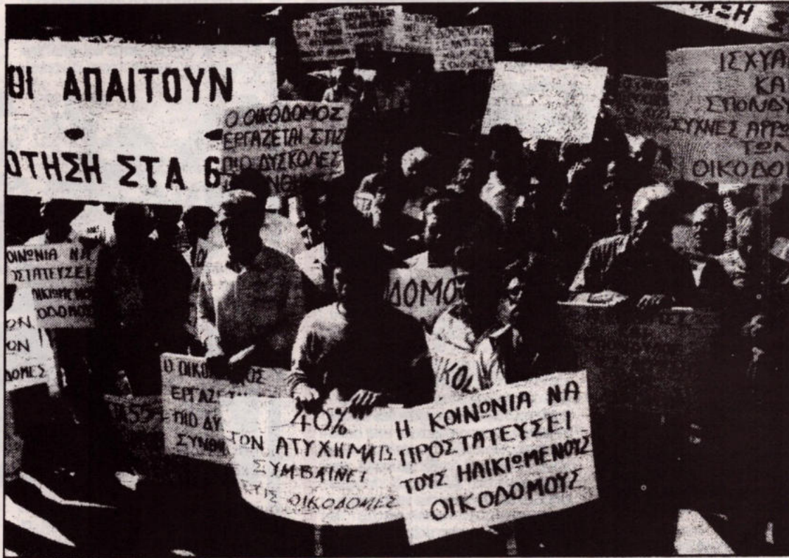
Οι οικοδομοί κινητοποιούνται για συντάξη στα 60. Τώρα θα πρέπει να ικανοποιηθούν με τα 63.

μεγάλη μαζα των συνταξιούχων με τα σοβαρά οικονομικά προβλήματα που αντιμετωπίζει δεν θα μπορεί να αφιπηρετεί στα 63. Οι συνταξιούχοι για να έχουν μια αξιοπρεπή ζωή αναγκάζονται ακόμα και σήμερα να εργάζονται μέχρι την τελευταία τους πνοή. Σίγουρα πολλοί θα αναγκάζονται να συνεχίζουν να δουλεύουν μέχρι τα 68 που είναι το υποχρεωτικό όριο για αφιπηρετήση. Εν τω μεταξύ η κυβέρνηση θα γλιτώνει για ακόμα τρία χρόνια από την υποχρέωση να