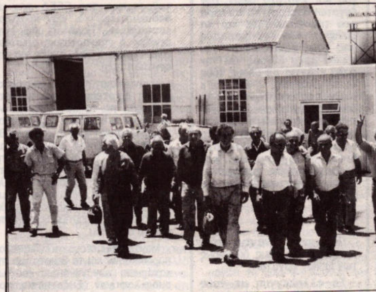
Οι εργαζομένοι στις Βασεις σε παλιότερη κινητοποίηση τους