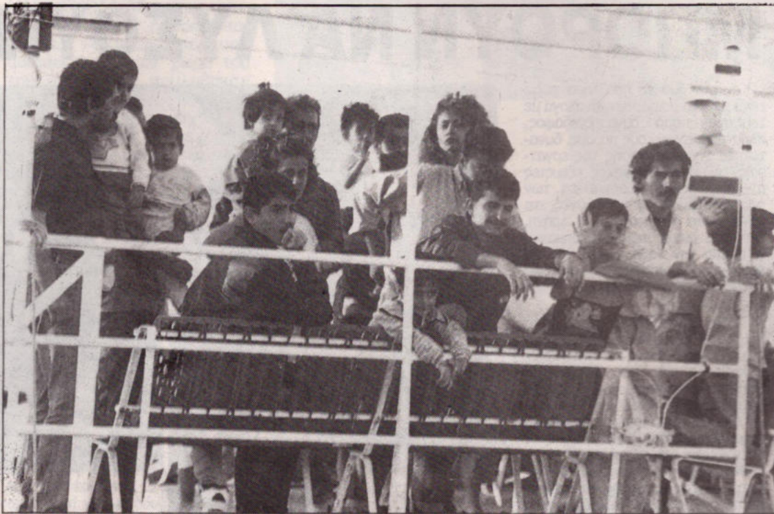
Το πλοίο «Κωστακης» και το ανθρώπινο φορτίο του στην «οριογραμμή».

Τοτε ηταν που ξεκινησε ο Ελληνοτουρκικος διαλογος για την λαθρομεταναστευση, αν επρεπε αυτοι οι 77 να γυρισουν στην Τουρκια, απο όπου