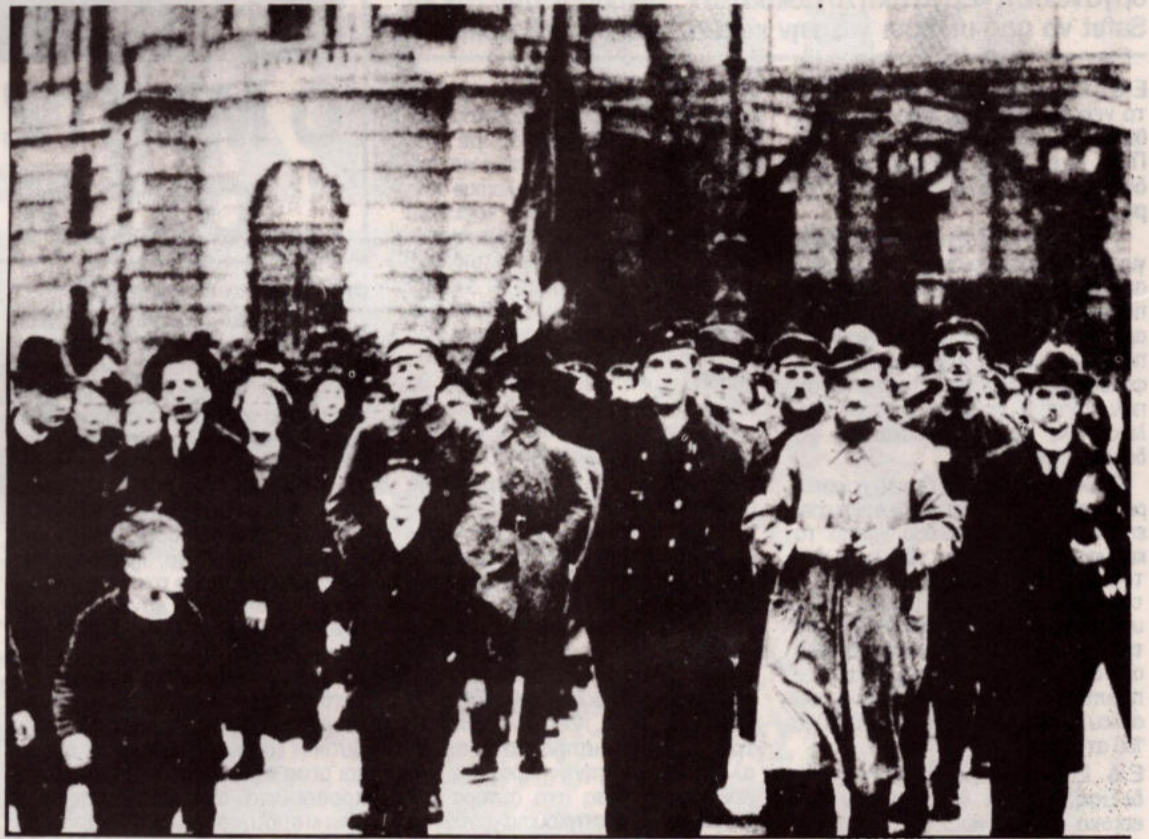
Εξεγερμενοι εργατες και στρατιωτες στο Βερολινο, στην Επανάσταση του 1918. Η Σοσιαλδημοκρατία προδωσε και αυτη την εξεγερση του προλεταριου.

Σε δημοσιογραφική διασκεψη στις 15 Μαρτη του '91 ο Χριστοφας, απαντώντας σε ερωτηση για το τι χωρίζει το κομμουνιστικό ΑΚΕΛ απο