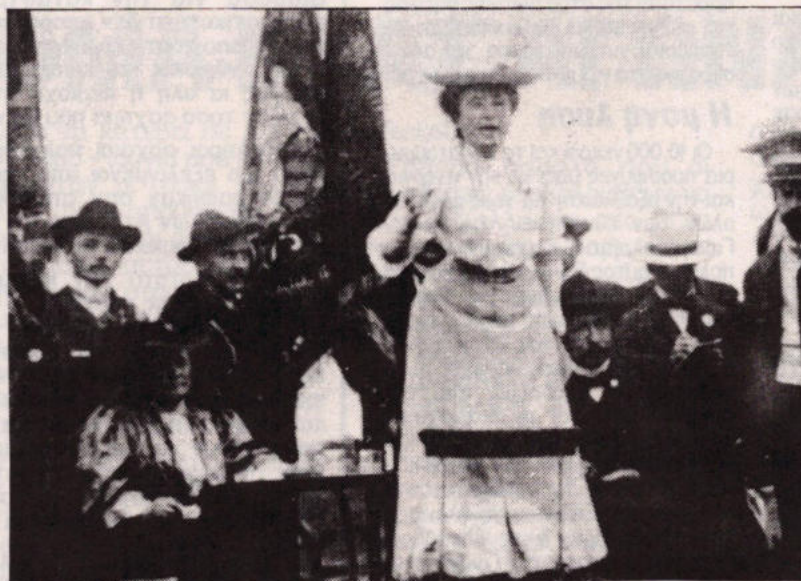
Η γερμανική Σοσιαλδημοκρατία προδωσε την Γερμανική Επανάσταση του 1918, και δολοφόνησε την ηγετίδα της, την Ρόζα Λουξεμπουργκ

Μετά τον θάνατο του Λένιν αυτο εκφραστήκε σαν ανοικτή πολιτική συγκρούση μέσα στο κόμμα, από τον Τροτσκι και την Αριστερή Αντιπολίτευση εναντία στους Σταλινικούς. Ο Τροτσκι όπως και ο Λένιν, έβλεπε την εξαπλώση της επαναστάσης στην Ευρώπη σαν το μονο σωστο δρομο για να μπορεσει να στρικήτει η Σοβιετική Ενωση.