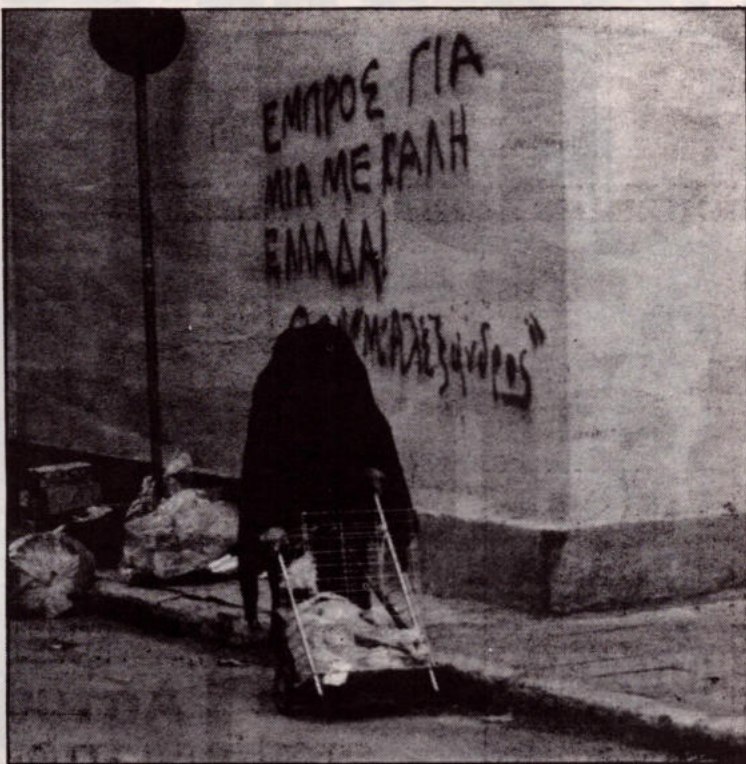
Η πολιτική της κυβέρνησης στα Βαλκάνια ανοίξε το δρόμο στους φασίστες υποστηρικτές της "Μεγάλης Ελλάδας"

Την δεκαετία του '60 φάνηκαν τα πρώτα σημάδια της οικονομικής κρίσης. Ο προσανατολισμός του Τίτο το '65 προς την οικονομία της αγοράς και η σύνδεση της οικονομίας με την παγκόσμια αγορά μέσω τραπεζικών δανείων και προσέλκυσης δυτικών επενδύσεων ήταν η αιτία των μεγάλων ανταγωνισμών ανάμεσα στις διαφορές δημοκρατίες. Σταματήσαν οι εμπορικές συναλλαγές μεταξύ τους με αποτέλεσμα να μεγαλώσουν οι αντιθέσεις ανάμεσα στον πλούσιο Βορρά και τον φτωχο Νότο. Η παγκόσμια οικονομική ύφεση του '80 επιδεινώσε την κρίση. Τα σκληρά μέτρα λιτότητας που επέβαλε το ΔΝΤ