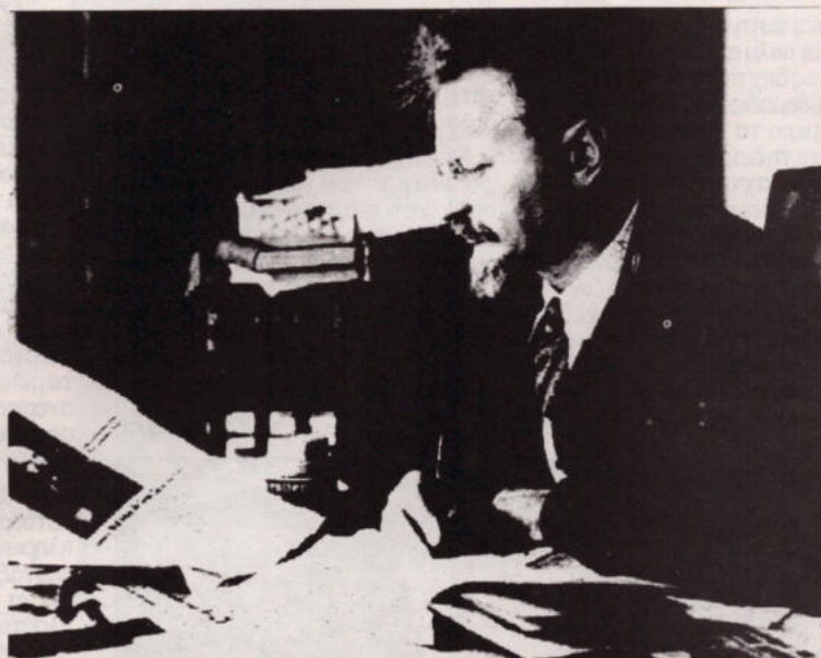
Ο Τροτσκι μεχρι την δολοφονια του απο τον Σταλιν το 1940 εδινε την μαχη εναντια σ τον Σταλινισμό

κταναναγκαστικης εργασιας, η αστυνομοκρατια, οι εξαφανισεις, δεν ηταν προσωπικα «εγκλήματα» του Σταλιν, η «λαθη στη εφαρμογη του σοσιαλισμου». Ηταν η πολιτικη της νεας κυριαχης ταξης για να μπορεσει να πραγματοποιησει μεσα σε λιγα χρονια την αναπτυξη της βιομηχανιας που αλλες χωρες χρειαστηκαν δεκαδες χρονια για να το πετυχουν.